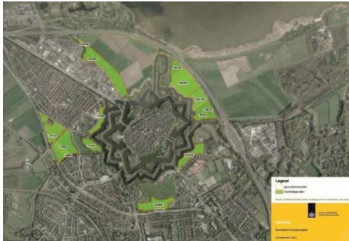
De overheidsgronden in het schootsveld

De gronden waren van de gemeente Gooise Meren. De gemeente heeft een subsidie gehad als vergoeding voor de opbrengst van de gronden. De gemeente steekt dit weer in het programma, en in het bijzonder in de aankoop en sloop van Energiestraat 1. Zo wordt met één subsidie zowel het schootsveld veiliggesteld als een stuk openheid hersteld.