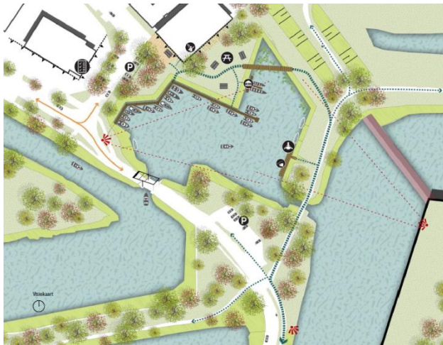
Afbeelding uit concept visie passantenhaven met de herstelde vestinggracht.

Het beschikbare budget is niet genoeg om alle overgebleven projecten uit te voeren. Daarom is ervoor gekozen dit eerst in te zetten voor het herstellen van de vestinggracht bij Naarden. Uit de participatie bleek dat veel mensen hier enthousiast over zijn. Dit project dient ook meerdere doelen. Het is ook een verfraaiing van de entree van de vesting en creëert de mogelijkheid om ligplaatsen te maken. Met de sloop van Energiestraat 1 is de ruimte voor de havenkom al vrijgespeeld. Over het type haven, passanten- of vaste ligplaatsen, wordt nog besloten.