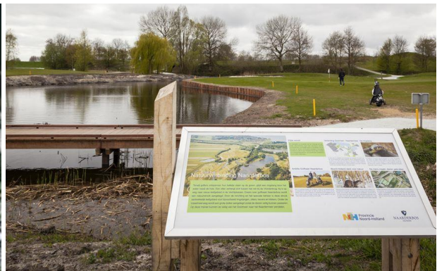
De ecologische verbinding en de passage over de golfbaan.