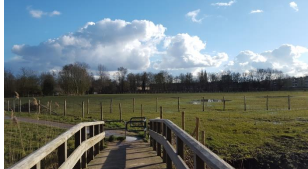
Herstelde openheid in het schootsveld